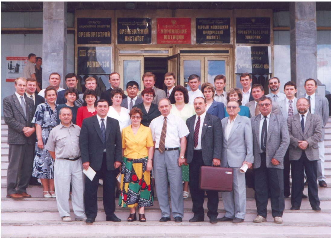
Студенты отделения целевой подготовки (1998 г.)