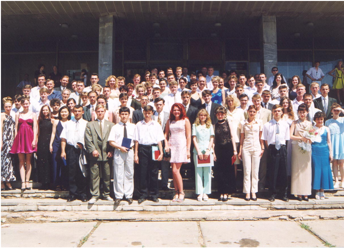
Выпускники дневного факультета (1998 г.)