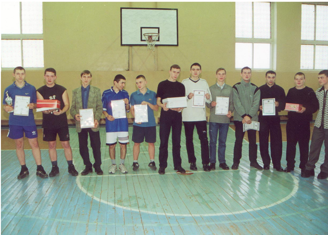
Победители первенства института по баскетболу (2000 г.)