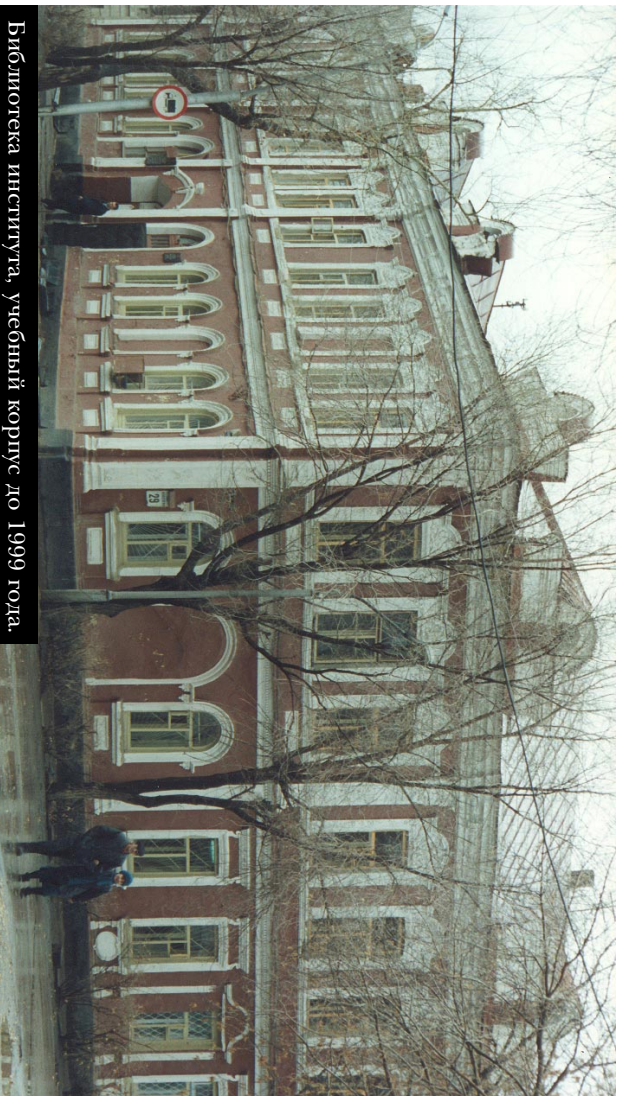
Библиотека института, учебный корпус до 1999 года.