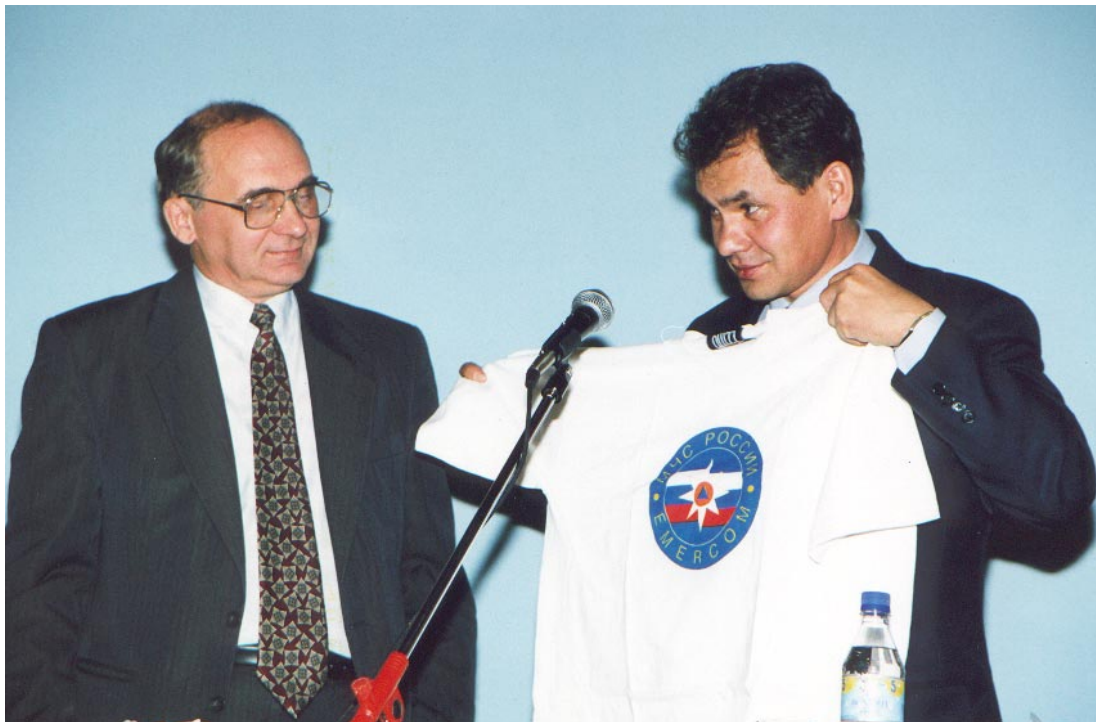
С. К. Шойгу, министр МЧС Российской Федерации и М. И. Полшков (1999 г.)