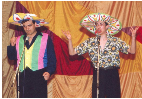
КВНщики института на игре в Воронеже.