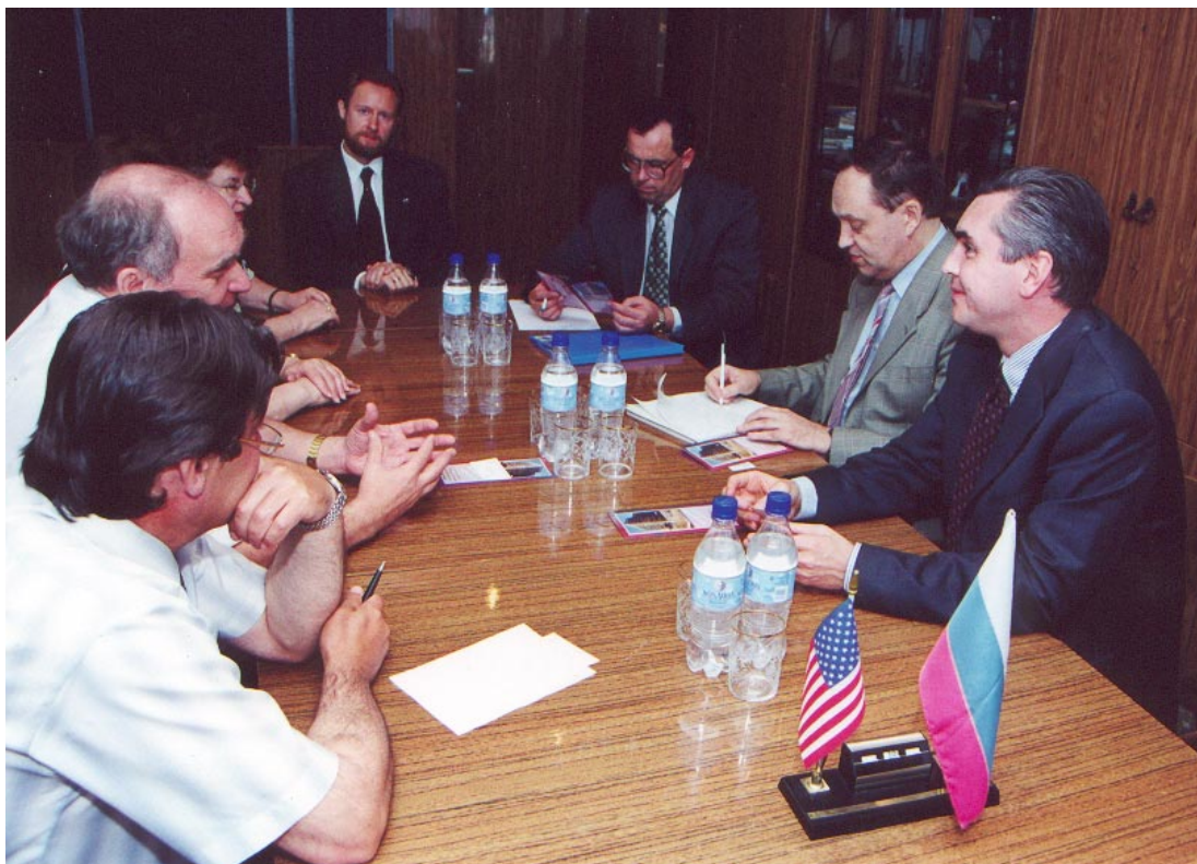
Скот ХАМИЛЬТОН (крайний справа), Генеральный консул американского консульства США в Екатеринбурге на встрече с руководством и преподавателями института.